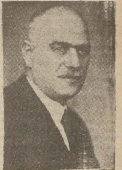
İktisad Vekili Hüsnü Çakır

Ankara 2 (Hususi) — Evvelce bildirdiğim iş ve işçi bulma teş- kilâtı kanun lâyihası bugün Mec- lise sevkolunmuştur. Mucib se- bebler lâyihasında ezcümle şöyle denilmektedir. «Memleketimizde gittikçe inkişaf eden iş hacminin muhtaç olduğu elemanların kolay- ca tedarik edilebilmesi ve iş isti- yen vatandaşların da vasıflarına göre elverişli oldukları işlere yer- leştirilmelerine tavassut olunması esasen devlet vazifeleri meyanına ithal edilmiş olduğundan, bu hizmetlerden vatandaşların tam bir serbesti ile istifade edebilme- leri için bu gibi tavassut işlerinin hiç bir ücret karşılığı olmadan ifa- sı usulü vazedilmiş bulunmakta- dır.»