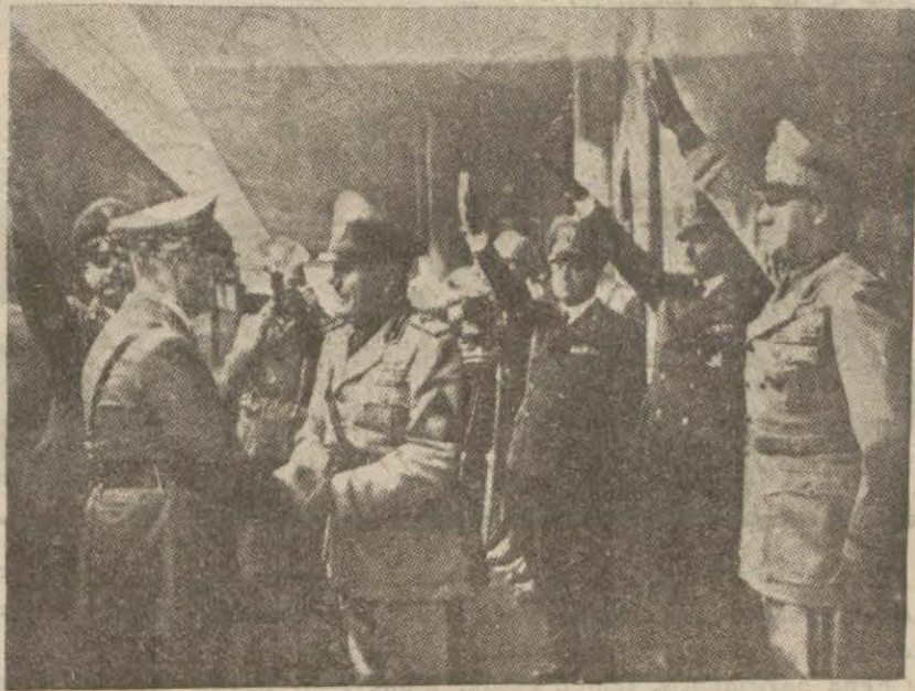
Bay Hitler ve Mussolini bundan evvelki Brenner mülakatlarından birinde karşı karşıya